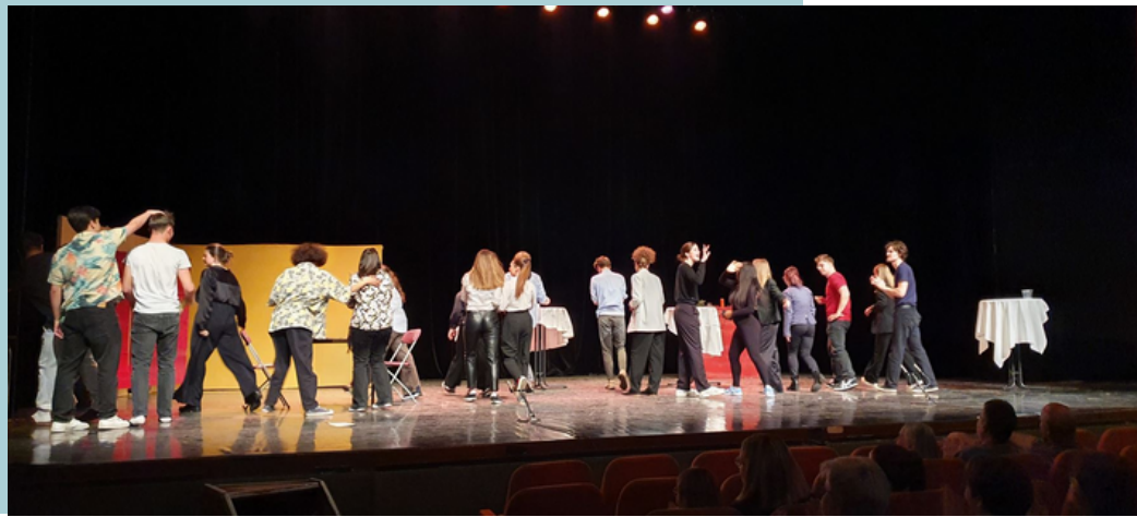
Spectacle d'art d'expression

Les compétences développées lors des deux années terminales viseront davantage l'autonomie, l'argumentation et le débat d'idées, nourri par des concepts développés par des théoriciens (sociologues, philosophes, pédopsychiatres, économistes, ...).